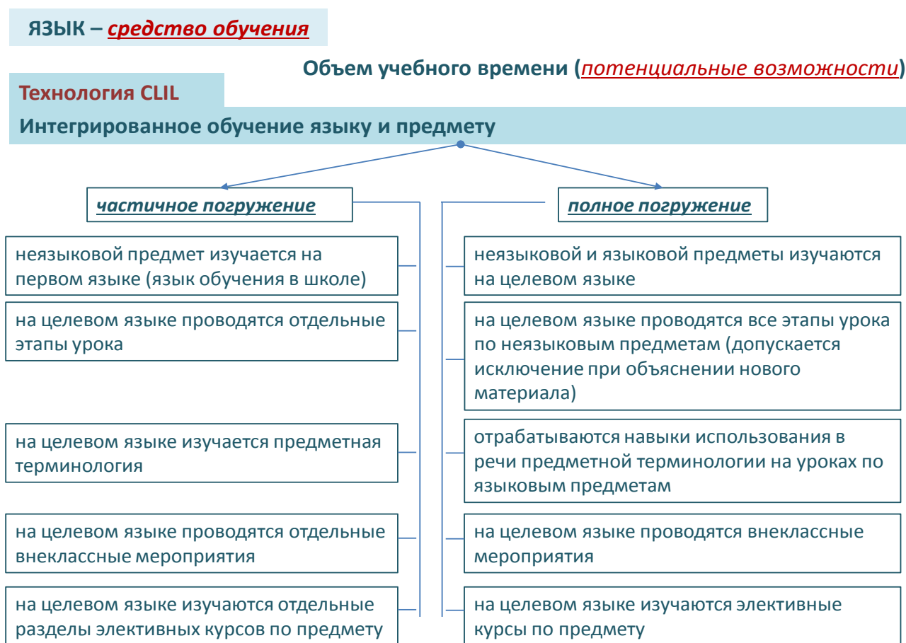
Таблица 2. Интегрированное обучение языку и предмету

Совместная работа учителей языковых и неязыковых предметов может принимать множество форм. Учителя иностранного языка на своих уроках могут отработать лексику по изучаемому предмету ЕМН. В организациях образования, где это возможно, учителя языковых и неязыковых предметов могут одновременно работать на одном уроке. Также педагоги могут работать совместно до и после уроков, обсуждая поставленные цели урока, учебные достижения учеников и необходимую поддержку для дальнейшего изучения учебных предметов ЕМН на английском языке.